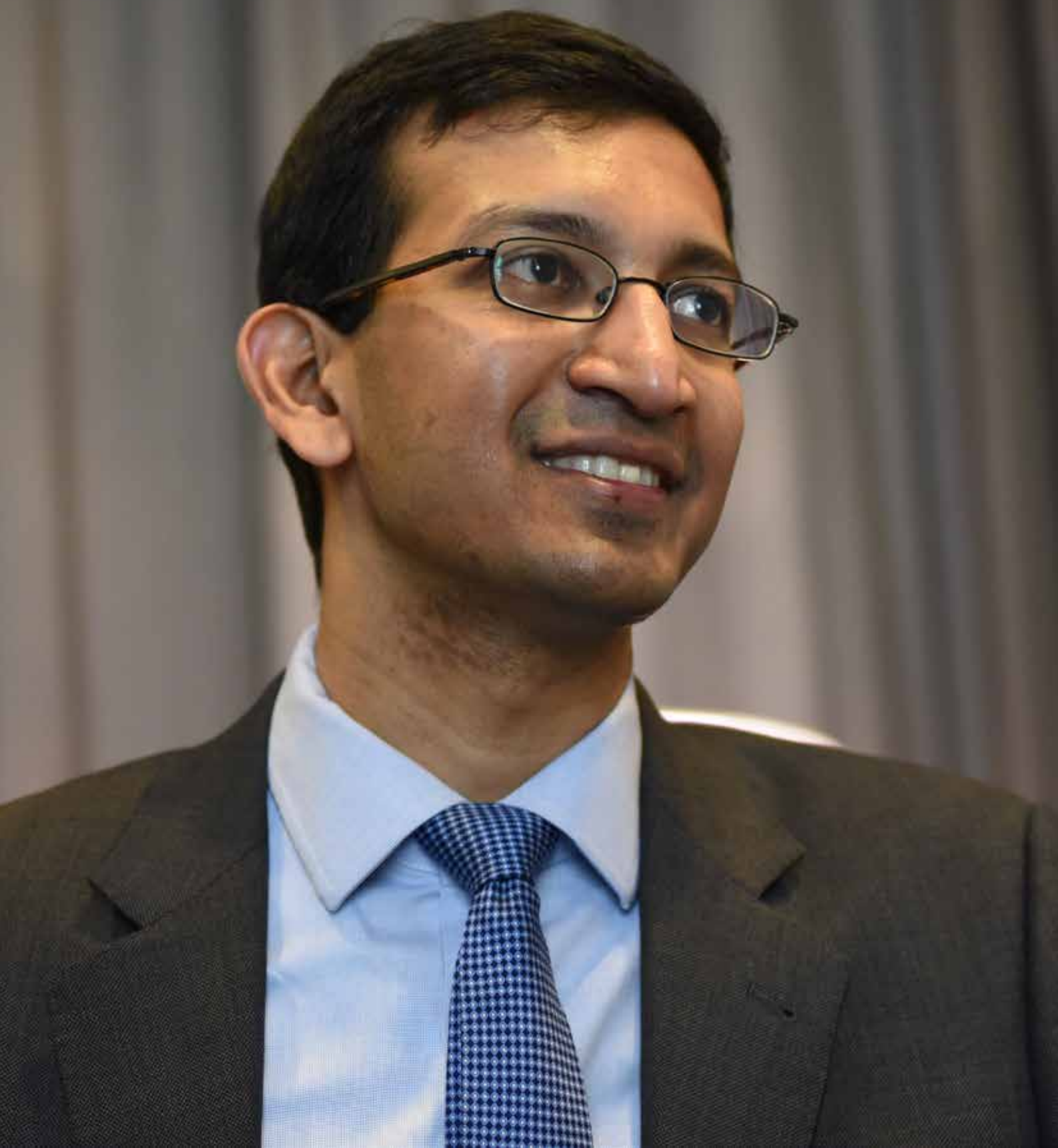
Raj Chetty, professor i nationalekonomi vid Stanford University